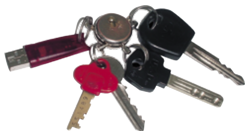
מפתח USB מקודד