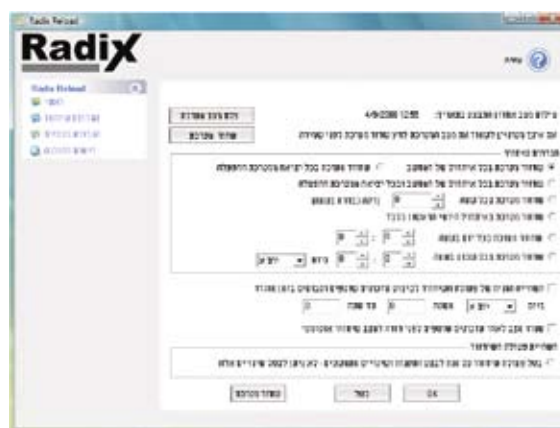
גירסת כיתת הדרכה